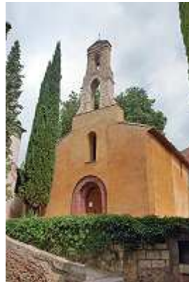
Kirche von Escaladei