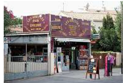
Lädchen vor dem Camping

Während eines Ausflugs in das nahe gelegene Sète fielen uns bei der Fahrt entlang des Strandes hunderte hier parkende und badeurlaubende Wohnmobile auf. Vermutlich war das schon immer so, jedenfalls geben die Bau- oder Municipalbehörden dem Gewohnheitsdruck nach und legen entlang der Küste neue Parkstraßen an.