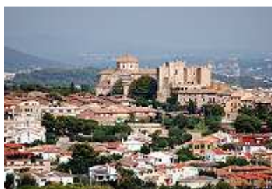
Blick auf Altafulla

Wer im Tamarit-Park campst, kommt nicht umhin, irgendwann eine Ausfahrt nach dem nur 5 km entfernten Altafulla zu machen und sei es nur zum Einkaufen oder Tanken. Der Ort ist aber viel zu hübsch, um ihn nicht einer ausgedehnten Besichtigungstour zu unterziehen.