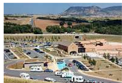
Rastplatz mit Informationspavillon