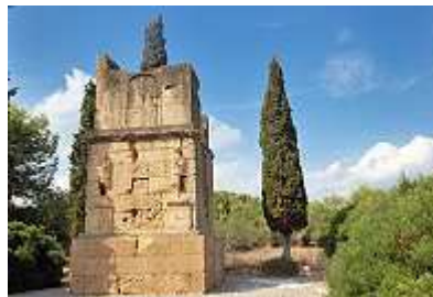
Turm der ScipionenTarragona