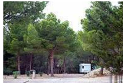
etwas triste Eckchen