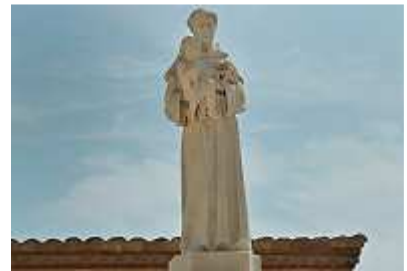
Marienbildnis in Altafulla