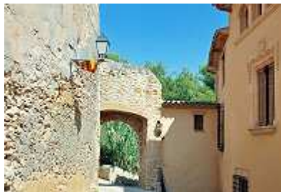
an der Burg von Altafulla