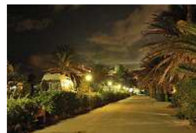
Nachts auf dem Camping