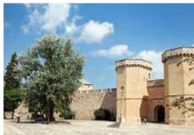
Eingang zum Kloster