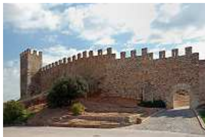
Stadtmauer von Montblanc

Außerhalb der Bade- und Gammelzeiten bewegten wir uns gern im spanischen Hinterland. Am katalanischen Nationalfeiertag waren wir in den Dörfern des Bergmassivs Montsant unterwegs. In Montblanc duften wir den artistischen Bau der traditionellen Menschentürme inmitten hunderter begeisterter Zuschauer erleben. Überall patriotisch geschmückte Dorfplätze und -straßen mit fröhlich, aber nicht übermütig feiernden Menschen. Auf dem Campingplatz war davon leider nichts zu spüren, schade eigentlich.