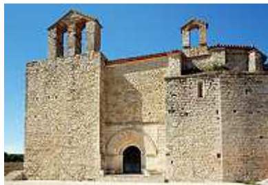
Sant jaume de Montagut

Jetzt mussten die kulturellen Bedürfnisse befriedigt werden. Dafür boten sich die Klöster Santes Creus und Poblet zwingend an. Vorher riskierten wir eine Anfahrt zur Sant jaume de Montagut, einer Burgkirche auf dem Montagut. Sie liegt zwischen Querol und Can Llenas, abseits aller verkehrsreichen Straßen in absoluter Einsamkeit, in der Ferne umgeben von verlassenen Höfen, weiten Höhen auf einem aussichtsreichen Gipfel. Urplötzlich fühlten wir uns in einen mexikanischen Western versetzt, zumindest aber daran erinnert, dass die Spanier ursächlich verantwortlich waren für die Architektur Süd- und Mittelamerikas.