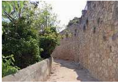
an der Stadtmauer