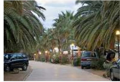
Der Platz am Abend

Was uns besonders auffiel, war die nicht angeordnete Mittagspause auf dem Campingplatz. Es herrschte trotzdem eine angenehme Ruhe. Kein Autofahrer musste vor der Einfahrt stundenlang warten, man konnte jederzeit zum Einkauf oder zur Hinterlandsbesichtigung aus- und einfahren, langsam und leise. Kinder konnten trotzdem spielen, ohne in den fehlenden Sperrstunden brutal überfahren zu werden.