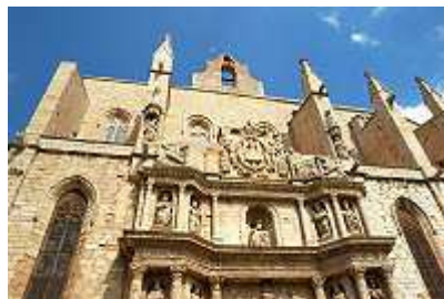
Església de Santa Maria