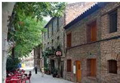
im Weiher Escaladei

Weinkenner geraten jetzt garantiert ins Schwärmen. Wir hatten keine Ahnung von der Berühmtheit der Region. Eigentlich wollten wir die Ruinen des 1163 gegründeten Kartäuser-Klosters Cartoixa d'Escaladei besuchen, was wir auch taten. Doch dann konnten wir einem Einkauf des hier angebotenen berühmten Siurana – Olivenöls nicht widerstehen. Sicher trug der herzliche Empfang mit Umarmung und einem uns wörtlich nicht zu verstehenden Begrüßungsschwall durch die Besitzerin des historischen Lädchens zum Kaufentscheid nicht unwesentlich bei. Ab sofort gehören wir aber seitdem zu den Kennern und Liebhabern des mit dem Namen „Siurana“ geschützten hochwertigen Olivenöls.