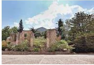
Ruine Kloster Poblet