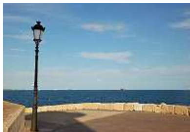
am Hafen von Tarragona

Neu gebaute Straßen schaffen eine Schnellverbindung nach Tarragona. Sie sind so neu, dass man sie noch auf keiner Landkarte findet. Und selbst unser mit aktuellstem Kartenmaterial ausgestattetes Navi signalisierte, dass wir uns in der Wildnis befinden oder dachte, wir benutzen die parallele Autobahntrasse. Wir besuchten die Stadt gleich mehrere Male, hauptsächlich zum Einkaufen. Natürlich gönnten wir uns auch eine Ortsbesichtigung mit Hafenrundgang und Citybesuch. Letzteres unternahmen wir per Auto, wofür wir uns ausgerechnet die Hauptverkehrszeit aussuchen mussten. War ziemlich viel Betrieb auf den Straßen. Interessant war die Besichtigung der beiden Bahnhöfe, von denen der Fernbahnhof weit außerhalb der Stadt neu angelegt ist und wegen der ETA-Anschläge auf Mallorca bewacht und kontrolliert wird wie ein Übersee Flughafen. Der Bahnhof in der City ist um einiges interessanter.