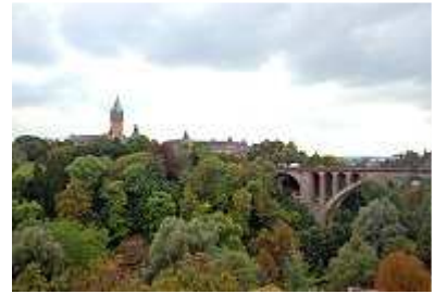
Adolphe-Brücke und Sparkasse