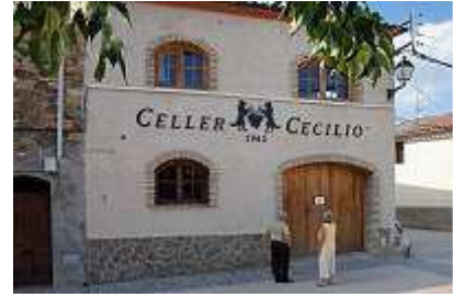
Weingut Cella Cecilio

Jetzt mussten die kulturellen Bedürfnisse befriedigt werden. Dafür boten sich die Klöster Santes Creus und Poblet zwingend an. Vorher riskierten wir eine Anfahrt zur Sant jaume de Montagut, einer Burgkirche auf dem Montagut. Sie liegt zwischen Querol und Can Llenas, abseits aller verkehrsreichen Straßen in absoluter Einsamkeit, in der Ferne umgeben von verlassenen Höfen, weiten Höhen auf einem aussichtsreichen Gipfel. Urplötzlich fühlten wir uns in einen mexikanischen Western versetzt, zumindest aber daran erinnert, dass die Spanier ursächlich verantwortlich waren für die Architektur Süd- und Mittelamerikas.