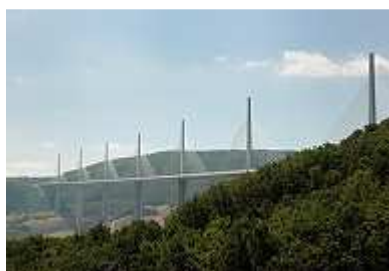
Der Viadukt von Millau von Norman Foster