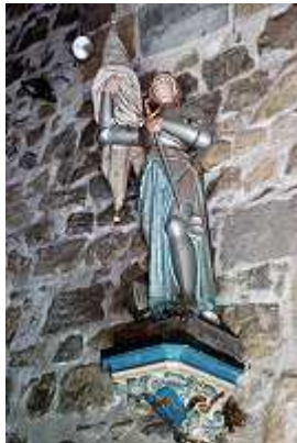
Kirche Saint-Mary in Orcet