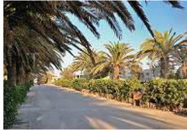
Stellplätze am Meer