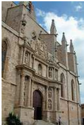
Santa Maria in Montblanc