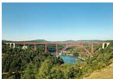
Der Garabit-Viadukt Gustave Eiffels bei Saint-Flour

Die dritte Etappe rollte über die Autobahn A75 Richtung Narbonne. Eine tolle Strecke, die immer wieder mal auf über 1000m anstieg, mit vielen Teilstücken, die bei 6prozentigen Abfahrten für Gespanne auf 60km/h beschränkt waren. Unterwegs legten wir zwei ausgedehnte Besichtigungspausen an den technischen Brückenkunstwerken der Herren Gustave Eiffel und Norman Foster ein.