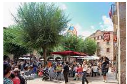
Nationalfeiertag in Montblanc