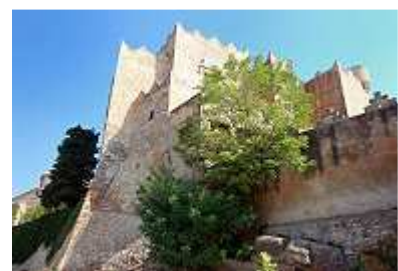
die Burg von Altafulla