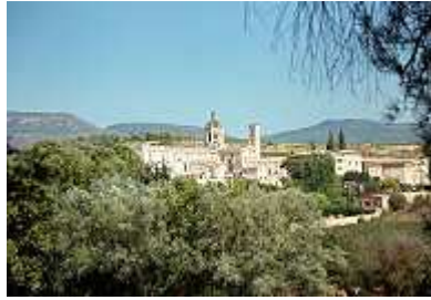
Gesamtansicht von Santes Creus