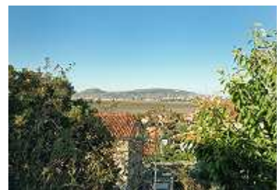
Blick in die Auvergne

Die dritte Etappe rollte über die Autobahn A75 Richtung Narbonne. Eine tolle Strecke, die immer wieder mal auf über 1000m anstieg, mit vielen Teilstücken, die bei 6prozentigen Abfahrten für Gespanne auf 60km/h beschränkt waren. Unterwegs legten wir zwei ausgedehnte Besichtigungspausen an den technischen Brückenkunstwerken der Herren Gustave Eiffel und Norman Foster ein.