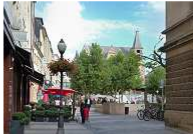
Place D'Armes in der Altstadt