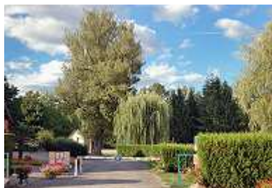
Einfahrt in Camping Les Castors

Am Ende des ersten Tages unserer Reise empfing uns in Frankreich Camping Les Castors in Burnhaupt le Haut. Ein schöner Platz. Noch angenehmer in Erinnerung bleiben wird uns die elsässische Küche der platzeigenen Gaststätte. Es gab gefüllte Nudelrolle und Wurstsalat, bewacht von zwei riesigen Hunden im Gastraum. Dass draußen ein Hinweis auf Hundeverbot hing, ist vermutlich eine Schutzmaßnahme für kleinere Artgenossen, damit diese nicht versehentlich von den Platzbeherrschern verspeist werden.