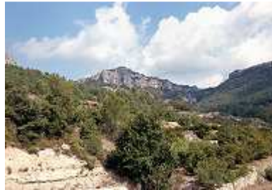
in den Bergen bei Prades