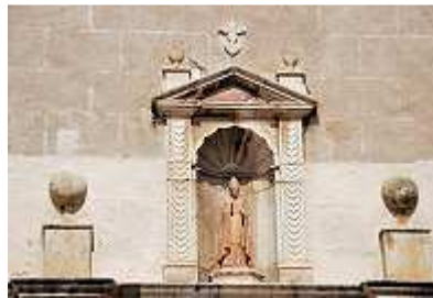
Kirchenportal in Altdfulla