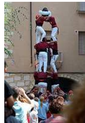
Castellers beim Menschenturmbau

Der katalanische Nationalfeiertag war vorbei und die erst vor einigen Tagen scharenweise eingefallenen Spanier waren weg. Mit dem Verschwinden der Spanier endete auch schlagartig die allabendliche Animation. Trotzdem füllte sich der Platz wieder – mit deutschen Rentnern. Sie genossen den letzten Monat des geöffneten Campings, bevor sie wieder ins kalte Heimatland, lieber aber weiter nach Süden ins Winterquartier ziehen. Warum nicht gleich in den Süden, fragten wir. Weil es hier so schön ist: der Platz, die Burgansicht, der Strand und die vielen Palmen, bekamen wir zur Antwort.