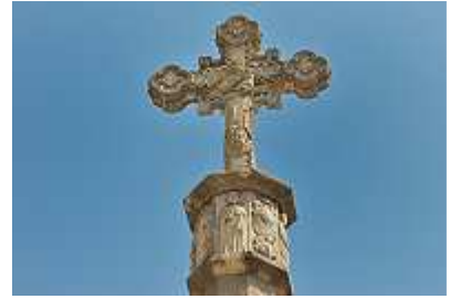
im Kloster Poblet