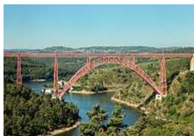
Der Garabit-Viadukt Gustave Eiffels bei Saint-Flour