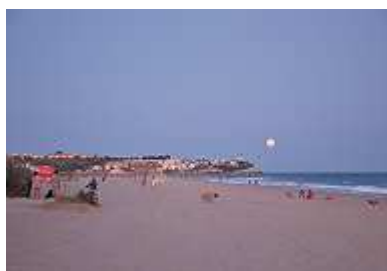
Strand am Abend

Der katalanische Nationalfeiertag war vorbei und die erst vor einigen Tagen scharenweise eingefallenen Spanier waren weg. Mit dem Verschwinden der Spanier endete auch schlagartig die allabendliche Animation. Trotzdem füllte sich der Platz wieder – mit deutschen Rentnern. Sie genossen den letzten Monat des geöffneten Campings, bevor sie wieder ins kalte Heimatland, lieber aber weiter nach Süden ins Winterquartier ziehen. Warum nicht gleich in den Süden, fragten wir. Weil es hier so schön ist: der Platz, die Burgansicht, der Strand und die vielen Palmen, bekamen wir zur Antwort.