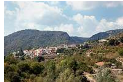
Blick auf la Febro

Weinkenner geraten jetzt garantiert ins Schwärmen. Wir hatten keine Ahnung von der Berühmtheit der Region. Eigentlich wollten wir die Ruinen des 1163 gegründeten Kartäuser-Klosters Cartoixa d'Escaladei besuchen, was wir auch taten. Doch dann konnten wir einem Einkauf des hier angebotenen berühmten Siurana – Olivenöls nicht widerstehen. Sicher trug der herzliche Empfang mit Umarmung und einem uns wörtlich nicht zu verstehenden Begrüßungsschwall durch die Besitzerin des historischen Lädchens zum Kaufentscheid nicht unwesentlich bei. Ab sofort gehören wir aber seitdem zu den Kennern und Liebhabern des mit dem Namen „Siurana“ geschützten hochwertigen Olivenöls.