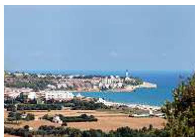
der Leuchtturm von Altafulla