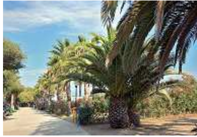
Palmen am Meer