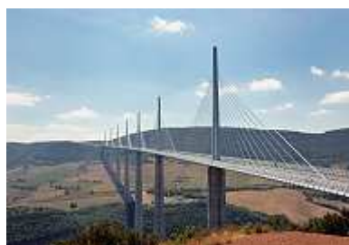
Der Viadukt von Millau von Norman Foster