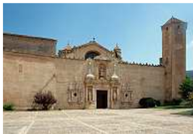
Kloster Santa Maria de Poblet

Das Monestir de Santa Maria de Poblet ist das größte und prächtigste Königskloster Spaniens, zugleich das umfangreichste und besterhaltene Zisterzienserkloster des Abendlandes. Es entstand als Triumphzeichen und steinerne Danksagung für die Vertreibung der muslimischen Araber. Als Weltkulturerbe wird es gegenwärtig restauriert, was allerdings zu fast verschandelnden modernen architektonischen Neubauten im Eingangsbereich führt. Da kommt Unbehagen auf.