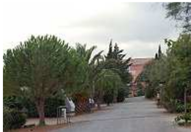
Einfahrt zum Campingplatz

In Eingangsnähe innerhalb des Campingplatzes schockte eine ausgebundelte Baugrube, bis wir erkannten, dass es sich hierbei um einen neu angelegten Stellplatz handelte. Na ja! Die Pflanzenwelt des Campingplatzes hatte bereits echten maritimen Charakter und machte Lust auf die Tour nach und in Spanien. Aber vorerst genossen wir französische Freuden, befanden wir uns doch inmitten eines großen Weingebietes.