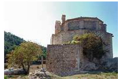
Seitenansicht der Burgkirche

Die Weiterreise in den nächsten Ort erinnerte an eine Achterbahnfahrt, kurvenreich und mit 25 prozentigen Bergabfahrten auf speziell für den Winter aufgerauten Sträßchen.