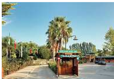
Einfahrt zum Platz

Zur Ein- und Ausfahrt in und aus dem Gelände gibt es eine automatische Schrankenöffnungserkennung, die beim Anblick unseres Autos sogar manchmal funktionierte. Wenn nicht, waren die Männer des Sicherheitsdienstes zur Stelle.