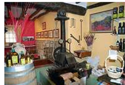
Ölverkauf in Escaladei

Hier im Weiher Escaladei gab es einige Weinkellereien, von denen wir wussten, dass sie den schweren Priorat-Wein verkaufen. Wir fragten unsere nette Ölverkäuferin, wo wir wohl den besten Wein erwerben könnten. Sie schickte uns nicht zu einer der hiesigen Bodegas, sondern empfahl uns das einige Kilometer entfernte Weingut Celler Cecilio im Dorf Gratallops, wobei sie über die Qualität des dort erzeugten Rebensaftes in schwärmerische Verzückung geriet. Wir folgten ihrem Rat und taten gut daran. Nach jahrelangem Suchen des für unseren Geschmack und Geldbeutel idealen Rotweins fanden wir ihn hier. Selbst der äußerst preiswerte en Vrac ausgeschenkte und in Kanister abgefüllte Tischwein kann mit wesentlich teureren Weinen anderer Anbieter mühelos mithalten – jedenfalls aus unserer Geschmacksrichtung. Die Begeisterung nach der ersten abendlichen Verkostung im Caravan veranlasste uns, ein weiteres Mal die Weingegend des Priorat in den steilen Hügeln der Serra de Montsant, etwa 30 km hinter Cambrils und Tarragona zu besuchen. Selbstverständlich statteten wir der Bodega Celler Cecilio einen erneuten Besuch ab.