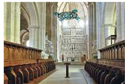
in der Klosterkirche

Wer im Tamarit-Park campst, kommt nicht umhin, irgendwann eine Ausfahrt nach dem nur 5 km entfernten Altafulla zu machen und sei es nur zum Einkaufen oder Tanken. Der Ort ist aber viel zu hübsch, um ihn nicht einer ausgedehnten Besichtigungstour zu unterziehen.