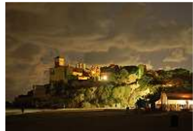
Die Festung Tamarit bei Nacht

Zur Ein- und Ausfahrt in und aus dem Gelände gibt es eine automatische Schrankenöffnungserkennung, die beim Anblick unseres Autos sogar manchmal funktionierte. Wenn nicht, waren die Männer des Sicherheitsdienstes zur Stelle.