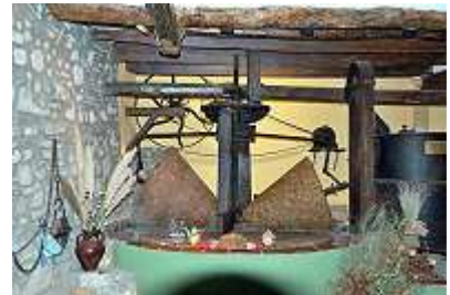
alte Ölpresse in Escaladei