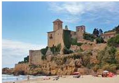
Die Festung Tamarit

Tamarit-Park liegt noch 100m weiter hinter einer Biegung und begrüßt seine Besucher nach linksseitiger Zauntoreinfahrt mit Eincheckspuren, Parkplätzen, Empfangsgebäude, Schrankenpassage und Sicherheitsdienst in attraktiv gestaltetem Ambiente. Und dann erst der Platz. Wir beschreiben ihn in seiner Anlage unter „Campingplätze“ ausführlich.