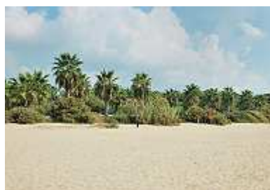
Palmen am Strand