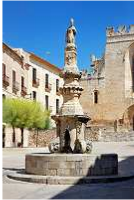
in Santes Creus