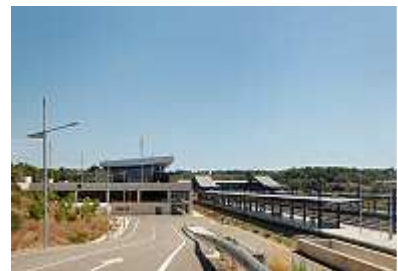
Fernbahnhof bei Tarragona