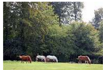
Reitstall am Campingplatz