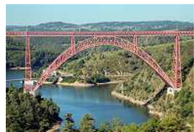
Der Garabit-Viadukt Gustave Eiffels bei Saint-Flour