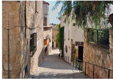
in den Gassen der Altstadt