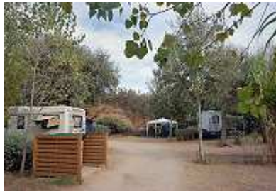
Stellplätze vor der Düne

Begegnung gewesenen Gespann abverlangte. Der Platz hinterließ keinen bleibend guten Eindruck. Einzig eine Stellplatznachbarin vermochte uns aufzuheitern. Sie führte ein Kaninchen am Halsband mit sich, das sie wie ein Hündchen liebevoll behandelte. Was besonders auffiel, waren die vielen Camper mit Hunden auf dem Platz. Lange konnten sie noch nicht da sein, denn Hunde waren in der Hauptsaison nicht erlaubt. Dabei wollen die doch auch ihren verdienten Urlaub genießen.