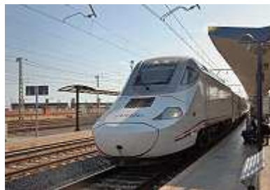
Bahnhof von Tarragona