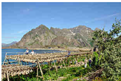
Stockfischernte in Henningsvær

Die ständig wechselnde Kulisse verengt sich, dehnt sich über weite Flächen aus und erhält einen weiteren Reiz durch die vielen roten, blauen und gelben Farbtupfer auf dem Grün der Wiesen in Form ferner Hütten und Häuschen. Ein weiterer Anziehungspunkt sind die kleinen Fischerorte mit ihren ursprünglichen Hafenanlagen, den vielen Booten und Fischerkähnen, den auf Stelzen im Wasser stehenden Hüttenensembles und den allerorts voll mit trocknenden Dorschen behängten Stockfischgestellen.