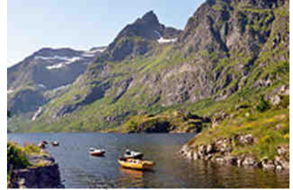
Å i Lofoten

Die Lofoten stellten wir uns immer ein wenig karg, die Infrastruktur noch ursprünglich vor. Vielleicht lag es an den wunderschönen Bildausschnitten alter Fischerhäfen und einsam verteilter Hütten. Alles ist so, aber man erlebt es völlig anders. Die Inselwelt hat nichts von ihrem natürlichen Charme verloren, doch ist sie nicht mehr die abgelegene Einsamkeit von einst.