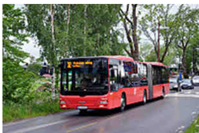
Stadtlinie vom Campingplatz

Weil es hier auf dem "Bogstad-Camping" so angenehm war, legten wir noch einen Tag zu zwecks Besichtigung der Hauptstadt. Der Bus hält direkt vor dem Camp und brachte uns schnell ins Stadtzentrum. Stockholm, Helsinki und jetzt Oslo, fehlt nur noch Kopenhagen und wir haben sie wenigstens gesehen, die wichtigsten skandinavischen Hauptstädte, jede für sich ein sehenswertes Juwel.