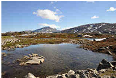
E10 nahe der Reichsgrenze

Es geht hinauf auf das Björn-Fjell mit direktem Schneekontakt und wieder völlig anderen Sichten als die bisher durchfahrenen Fjells an der E6. Hier oben passiert man die Grenze nach Schweden.