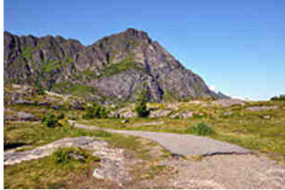
Wegende auf den Lofoten