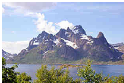
Trollfjord bei Digermulen

Außerordentlich schön empfanden wir die Fahrt auf der Straße entlang des Trollfjordes, auch als Raftsund bekannt, mit der Aussicht auf den Fjord und den aus ihm herauswachsenden Bergriesen. Während der Fahrt nach Digermulen begleitete uns ein Fährschiff, das uns immer wieder zu Fotoaufenthalten zwang.