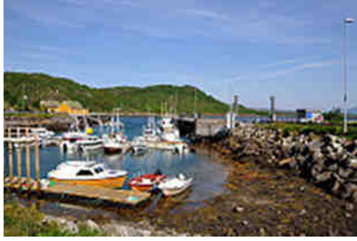
Am Fähranleger Skutnik