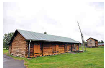
Lappendorf in Jukkasjärv