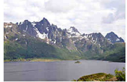
Blick auf Norwegian Sea