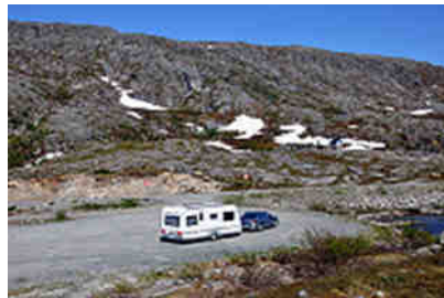
Abschied von Norwegen