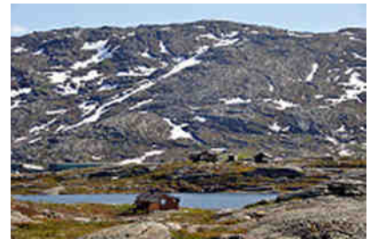
auf dem Björn-Fjell

Und schlagartig ließ der bisher schon schwache Autoverkehr nach, wir fuhren fast einsam weiter auf der E10. Jetzt begleitete uns die Erzbahnstrecke von Narvik nach Kiruna durch schier endlose tundraartige Birkenwäldchen bis in die Eisenerzstadt Kiruna. Hier legten wir einen Aufenthalt auf dem "Ripan-Camp" ein.