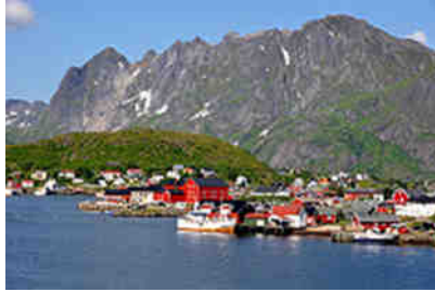
Blick auf Reine