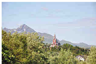
Kirche von Jerstad