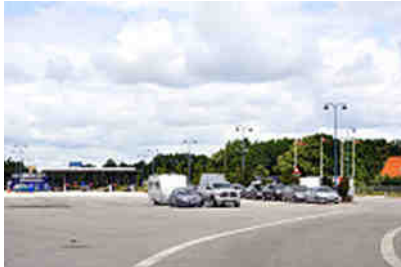
Im Hafen von Gedser

Wir fuhren weiter über Malmö, überquerten die Öresundbrücke ins dänische Gedser, um von dort per Fähre nach Rostock zu schippern. Klappte alles sehr gut. Die Fähre war pünktlich. An Bord gab es viele Restaurationen und Verkaufsstellen.