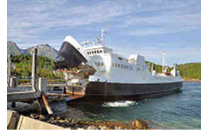
es geht an Bord

Die Überfahrt verlief trotz rauer See recht angenehm schaukelnd ruhig und pünktlich. Gegen 21 Uhr hatten wir endlich unser Reiseziel - die Lofoten - erreicht, aber noch keinen Campingplatz.