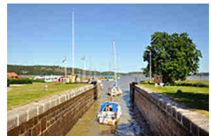
Men – Götakanal in die Ostsee