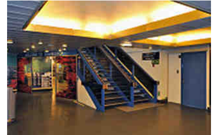
an Bord der Fähre

Wir wunderten uns: Das bei nur knapp 2 Stunden Überfahrt? Eigentlich hätten wir bereits beim Einfahren von 5 riesigen Reisebussen in den Fährbauch stutzig werden müssen. Massen an "Butterfahrern" entsprangen den Gefährten, drängten in Scharen in die "einfacheren" Restaurants und wälzten sich dann in die Free-Shops. Die Jüngeren schleppten kartonweise Bierdosen durch die Gefilde, während die zahlenmäßig bedeutendere Rentnerkolonie dezente Plastiktüten mit weniger, aber inhaltsreicheren Behältnissen zurück zu den Bussen trug.