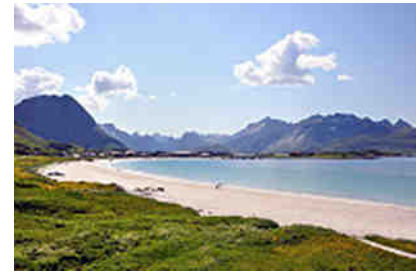
Strand von Ramberg

Halt! Alle sehenswerten Stellen zu bestaunen, ist auf den Lofoten schier unmöglich. Also blieben wir beim Möglichen. Und das hieß, entlang der Europastraße 10, bei Svolvær beginnend, in Richtung Süden bis zum Ende der Lofoten in Å und in Richtung Norden bis nach Fiskebøl die Touristenstraße (170 km) und viele ihrer kleinen Nebenabstecher und Rundreisewege zu erkunden.