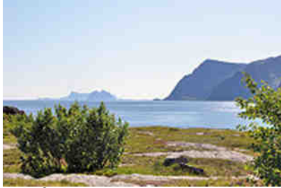
Å am Ende der Lofoten