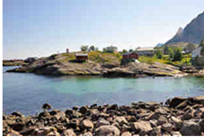
am Ortseingang von Å