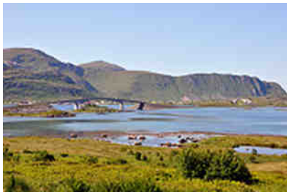
Brücke bei Ramberg

Gute Straßen erschließen jedes ferne Eckchen, auch wenn sie abseits der Hauptader - der E10, oder dem Kong-Olavs-Veg, wie sie hier heißt - ziemlich schmal und eng werden können. Mächtige Brückenbauwerke haben den vielen Fähren von einst den Garaus gemacht, schön und praktisch.