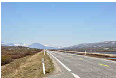
E6 über das Fjell

Für die Fahrzeuginsassen boten sich derweil wunderschöne Landschaftsansichten wilder Flüsse mit ihren Stromschnellen, schneebedeckten Berghöhen, tiefen Wäldern und nicht zuletzt die Überquerung des Saltfjellet mit selbstverständlichem Zwangsaufenthalt am hier wirksam in Szene gesetzten Polarkreis. Wie kann es da jemandem langweilig werden?