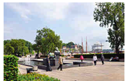
Hafen vor dem Rathaus