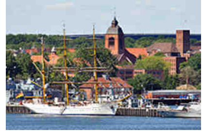
Die "Gorch Fock" in Kiel