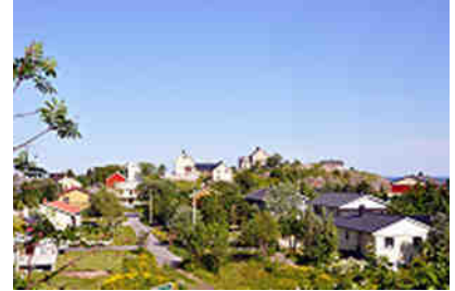
Sørvågen i Å i Lofoten