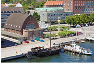
Im Kieler Hafen