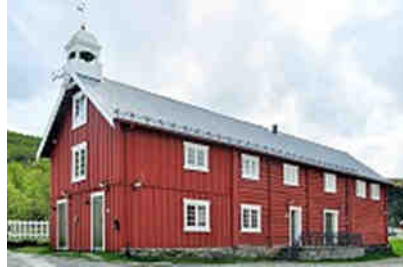
Kongsvold auf dem Fjell