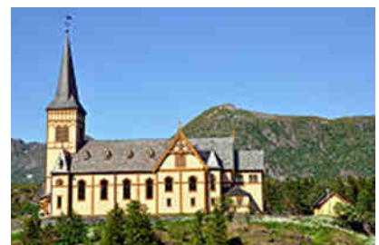
Lofotenkathedrale in Kabelvåg

Empfehlenswert ist auch die Rundfahrtstrecke, abzweigend von der E10 über die 815 und 817 und zurück über die E10. Je weiter man Richtung Süden nach Å fährt, umso enger wird die Straße. Erst jetzt wird einem bewusst, wie viel Wohnmobile bereits in der Vorsaison auf den Lofoten unterwegs sind. Da möchte ich nicht in der Hauptsaison dabei sein.