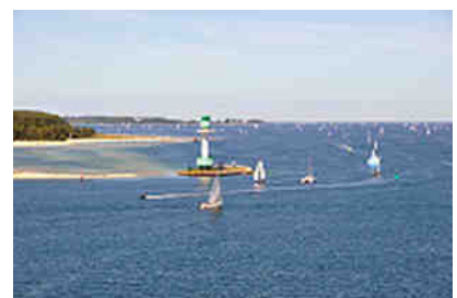
Segelboote auf der Förde

Die letzten Kilometer begleitete uns ein Militärhubschrauber, der die Fähre mehrmals hautnah umrundete, um schließlich im Standby-Modus den Anschein zu erwecken, im nächsten Moment auf dem Schiff landen zu wollen.