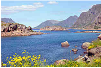
Straße 816 Henningsværveien