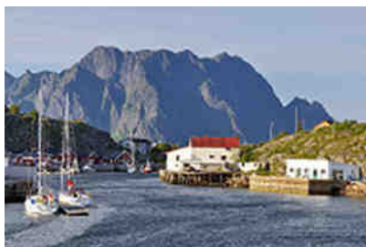
Insel Skrova vor Svolvær

Halt! Alle sehenswerten Stellen zu bestaunen, ist auf den Lofoten schier unmöglich. Also blieben wir beim Möglichen. Und das hieß, entlang der Europastraße 10, bei Svolvær beginnend, in Richtung Süden bis zum Ende der Lofoten in Å und in Richtung Norden bis nach Fiskebøl die Touristenstraße (170 km) und viele ihrer kleinen Nebenabstecher und Rundreisewege zu erkunden.