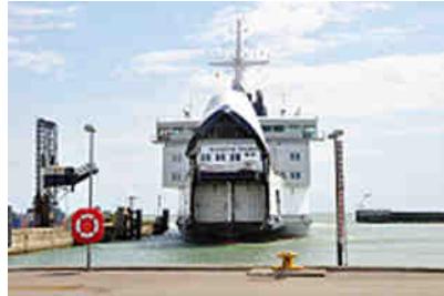
die "Kronprinz Frederik"