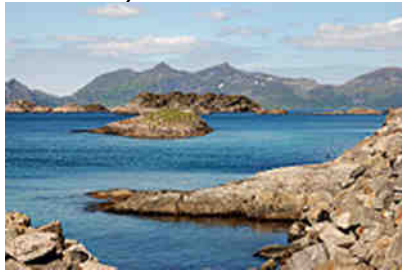
Henningsværveien Insel Scata