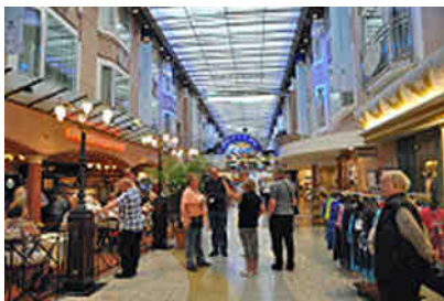
Ladenstraße auf Deck 7

Unermüdlich spuckten sie Massen an Passagieren aus und sammelten sie wieder ein. Zentrum der Betriebsamkeit waren die Stockwerke 6 und 7. Das 6. Deck bot neben einem riesigen Restaurant mit ausgebuchten Vorbestellungen für die abendliche Speiseeinnahme einen Free Shop für Alkoholika, Tabakwaren und anderen verbilligten Warenangeboten. Hier versammelte sich die Plastiktüten tragende Gemeinde bis in die späten Nachtstunden. Deck 7 war die Ladenstraße der gehobenen Preisklasse mit interessanten gastronomischen Einrichtungen und ebensolchen Preisen. Hier spielte sich das Innenschiffsleben ab. Man flanierte, beäugte einander und saß in einem der Cafés, Pubs oder Snackbars. Das Ende der ca. 100 m langen Passage bildete ein Restaurant mit einer mehrere Etagen überspannenden Heckfensterfläche.