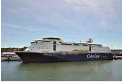
"Color Magic" im Kieler Hafen