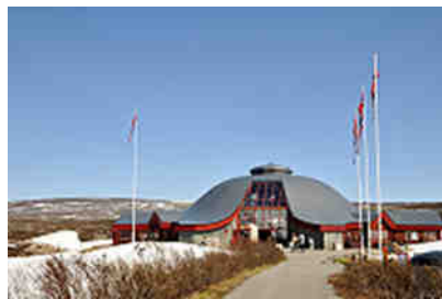
Krokstranda am Polarkreis