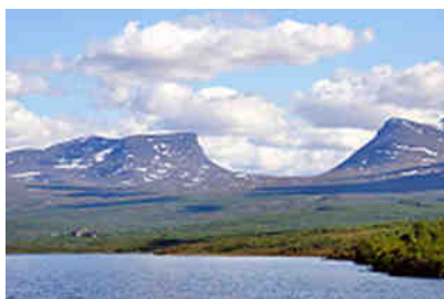
das Tor nach Lappland

Kiruna gehört zu den Erzstädten Nordschwedens, so ist auch die Stadt geprägt. Und wir bekamen sie zu Gesicht: die Riesenlokomotiven der gewaltigen Eisenerzzüge nach Narvik und Luleå. Dorthin führte uns bei strömendem Dauerregen die E10 durch endlose Wälder, vorbei an Seen und wilden Wassern.