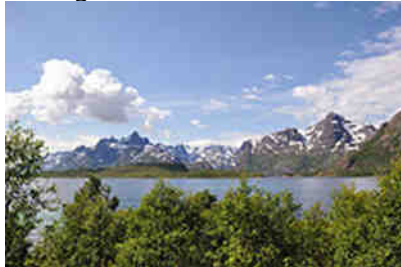
an der Fv868 bei Tennstrandvin