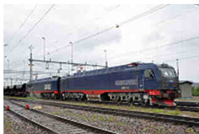
Riesenloks in Kiruna