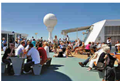
froh, an Bord zu sein

Auf der Fähre bezogen wir unsere Innenkabine, die einen recht angenehmen Eindruck bezüglich ihrer Bettenaufteilung und Gestaltung mit Kühlschrank und Fernsehgerät machte. Danach ging es ab zur Besichtigung des Fast-Kreuzfahrers. Auf dem Sonnendeck herrschte fröhliches Norwegerleben. Die Jungs waren schon recht angedudelt, lärmten, jubelten und sangen. Hatten sie doch erst den Vatertag in Deutschland hinter sich gebracht. Die Aussicht vom hohen Deck auf Kiel und seinen Hafen war fantastisch - "Color Fantasie" hieß unsere Fähre. Langsam verließ sie die Förde, zog vorbei an der Einmündung des Nord-Ostsee-Kanals und an hunderten von Segelbooten, die das herrliche Sonnenwochenende nach Himmelfahrt zum Begrüßen der schönsten Jahreszeit nutzten.