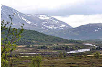
Auf dem Dovrefjell

Vor einigen Jahren fuhren wir die Parallelstraße 3/E6 zwischen Elverum und Trondheim, wir wissen also, wovon wir schreiben. Wir blieben im "Magalaupet Camping" hängen, Näheres kann man aus unserer zugehörigen Platzbeschreibung erfahren. In langer Erinnerung wird der Dovrefjell-Nationalpark bleiben.