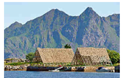
Stockfischgestelle bei Svolvær

Viel Zeug für eine Woche Reisezeit. Doch gesehen haben wir bei Weitem noch lange nicht viel von den vorhandenen Naturschönheiten. Was will man beschreiben? Am Anfang steht die einzigartige Symbiose von Fjorden, Meer und der gewaltigen Gebirgskette, die sich über eine endlose Zahl von Inseln erstreckt und gleichsam direkt aus dem Meer erwächst.