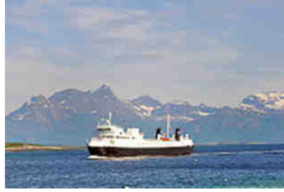
die Fähre kommt