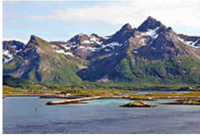
Blick von der Gimsøystraumen Brücke