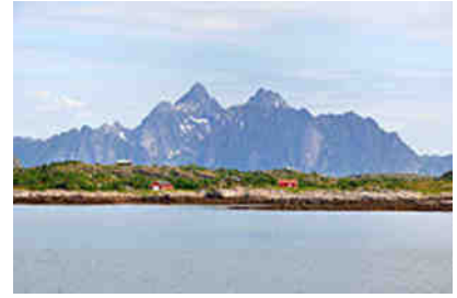
Straße 815 Valbergsveien