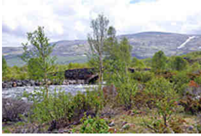
entlang der E6