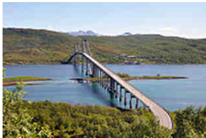
Brücke bei Litlenga